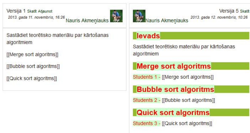
6. att. Versiju salīdzinājums

Viki rīkjoslā zem cilnes „Karte” iespējams apskatīt kopēju informāciju par Viki aktivitāti, kas galvenokārt saistītas ar Viki lapām. No kartes izvēlnes pieejamas šādas opcijas: