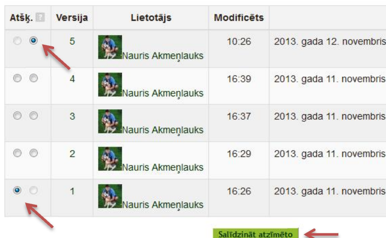
5. att. Viki lapas versiju izvēle

Izmantojot „Vēstures” cilni, ir iespējams apskatīt, kas, veidojot viki lapu, ir pielikts klāt un labots. Tas ir, pieejams saraksts ar versijām, kas tiek veidotas katru reizi, kad tiek saglabāta viki lapa. No versiju saraksta nepieciešams izvēlēties, kuras versijas salīdzināt, un jāspiež „Salīdzināt izvēlēto”.